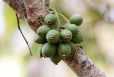
(e) Scleropyrum pentandrum