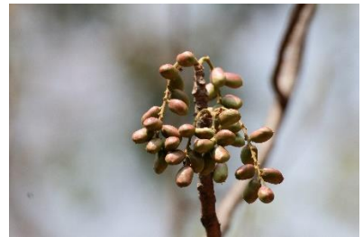
(i) Lannea coromandelica