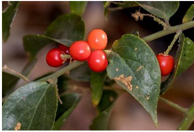
(a) Cansjera rheedei