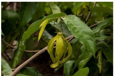
(j) Desmos chinensis