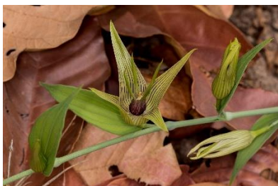
(m) Stemona phyllantha