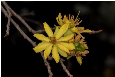
(g) Ochna integerrima