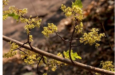
(f) Dalbergia velutina