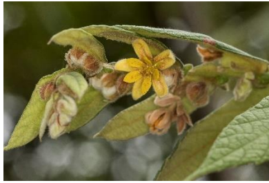
(b) Colona auriculata