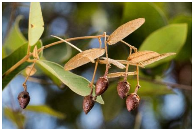
(d) Enkleia malaccensis