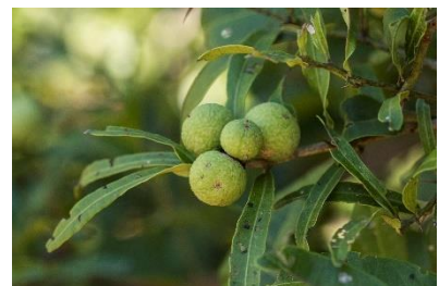
(o) Atalantia monophylla