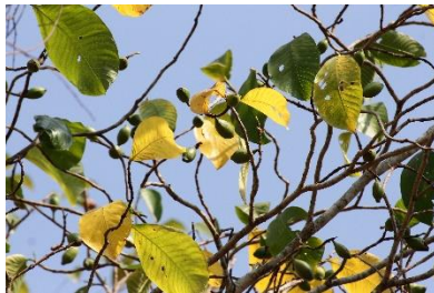
(h) Gardenia sootepensis