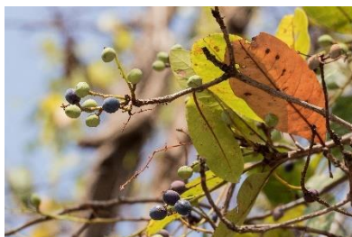
(n) Buchanania lanzan