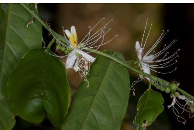
(k) Capparis micracantha